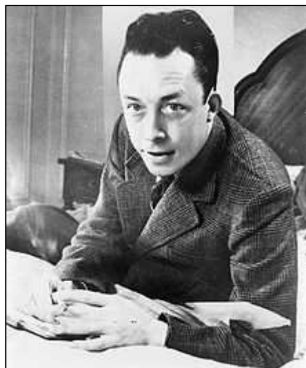
Albert Camus Premio Nobel per la Letteratura 1957

Ecco perché ogni autentica creazione è in realtà un regalo per il futuro.