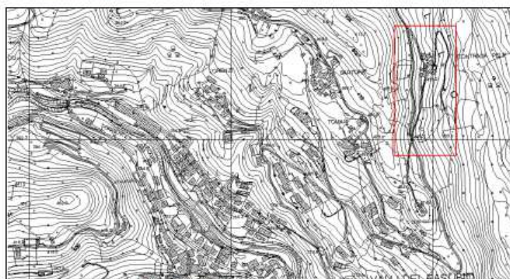
CTR elemento n°102084 Valli del Pasubio