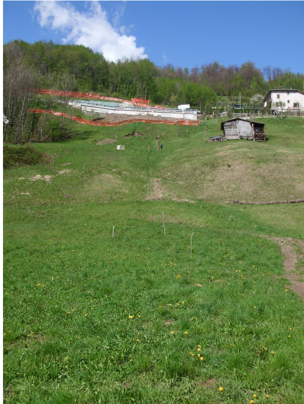
Zona a valle della strada ripristinata