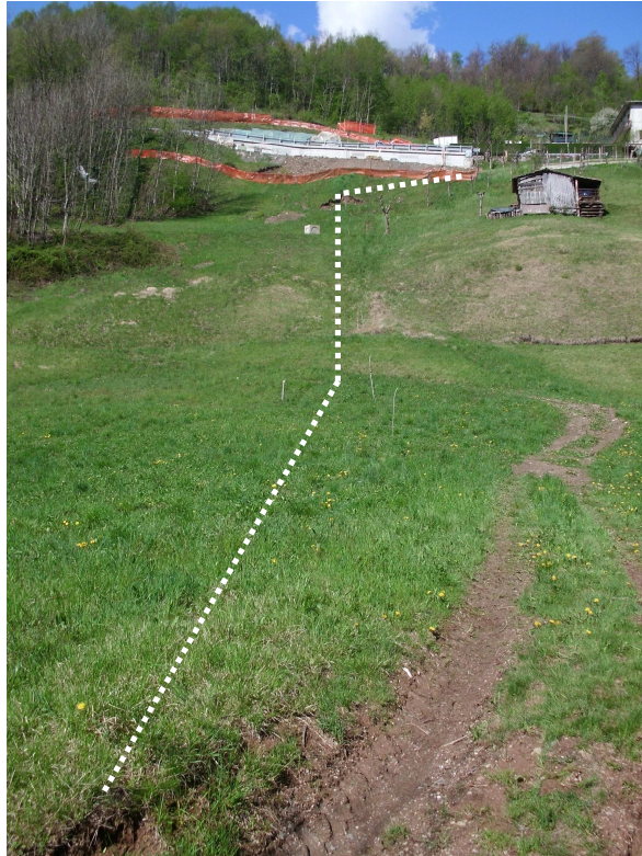
Zona compresa fra la strada di accesso a contrada Pelè ed il torrente (vista da valle)