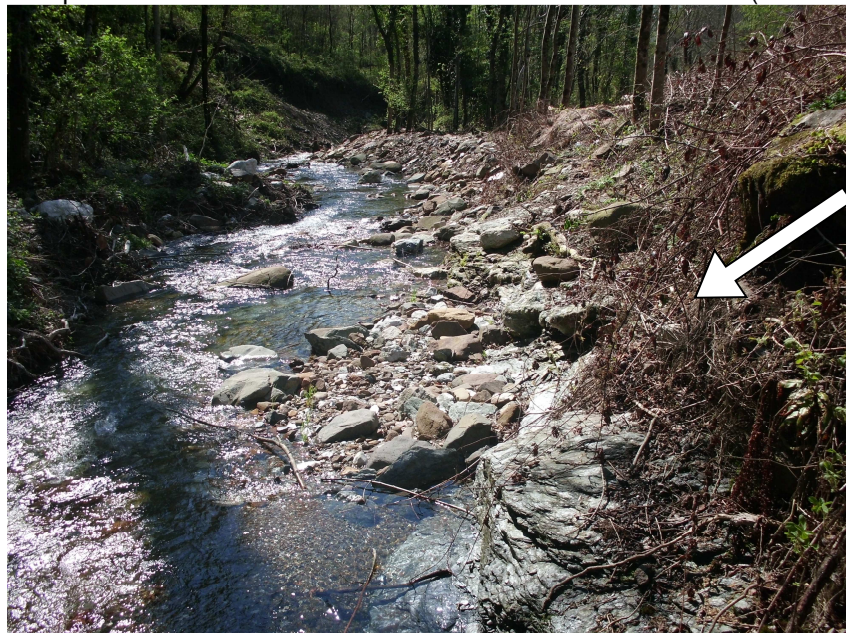
Torrente immediatamente a valle di contrada Pelè (a destra la zona per l'opera di restituzione)