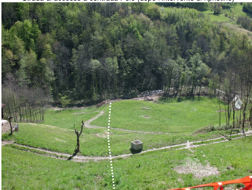
Zona compresa fra la strada di accesso a contrada Pelè ed il torrente (vista da monte)