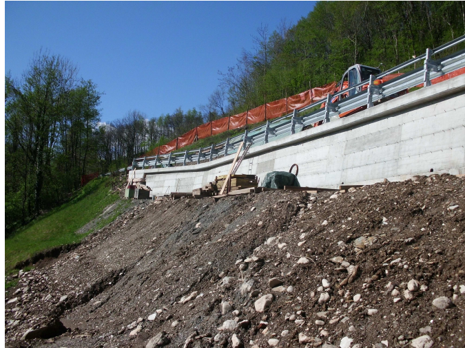
Intervento di ripristino della strada

Il terreno a monte e valle della strada ripristinata presenta una pendenza che va da media a forte. E' quindi necessario porre particolare attenzione alle manovre dei mezzi di scavo per evitare fenomeni di ribaltamento e scivolamento. La larghezza della carreggiata è limitata. Al termine della strada sono presenti 3 edifici ed un secondo accesso di dimensioni ridotte.