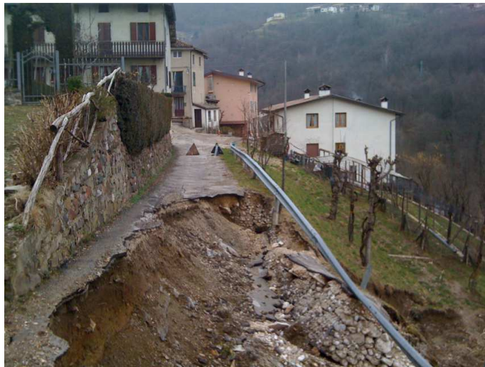
Zona franata (prima dell'intervento di ripristino della strada)

L'area di cantiere coincide con la zona compresa fra la strada comunale ed il torrente immediatamente a valle di contrada Pelè, in corrispondenza del tratto di strada ripristinato a seguito della frana, oltre all'area di manovra dei mezzi, alle aree di deposito materiale e attrezzature. Vista l'orografia del sito e le dimensioni ridotte della strada, la logistica di cantiere deve essere attentamente valutata. Questo al fine di limitare l'accumulo di materiale non necessario che potrebbe determinare l'aumento di rischi legati ad investimento, franamento ed urti. La strada ripristinata dopo la frana inoltre risulta essere l'accesso preferenziale per la contrada. Superiormente a tale strada è posta la strada comunale, mentre lateralmente è ubicata un'abitazione. Questo comporta la necessità di porre attenzione in fase di scavo e movimentazione del materiale.