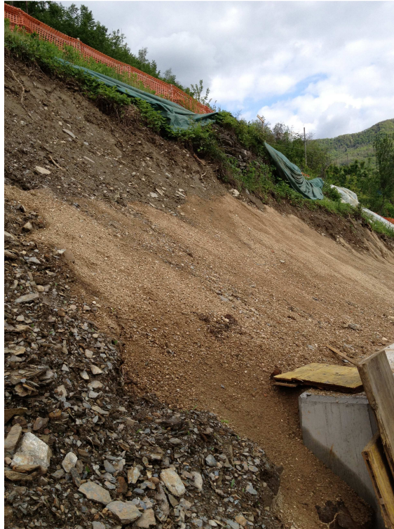
Pendio a monte del tratto di strada ripristinato a seguito della frana (sistemazione scarpata)